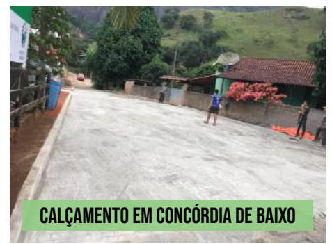
CALÇAMENTO EM CONCÓRDIA DE BAIXO