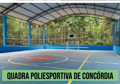
QUADRA POLIESPORTIVA DE CONCÓRDIA