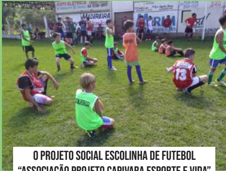
O PROJETO SOCIAL ESCOLINHA DE FUTEBOL "ASSOCIAÇÃO PROJETO CAPIVARA ESPORTE E VIDA"

Tem como sede campo de futebol e o ginásio poliesportivo localizado na comunidade de Capivara, o projeto atende cerca de 120 jovens e adolescentes de 04 a 17 anos.