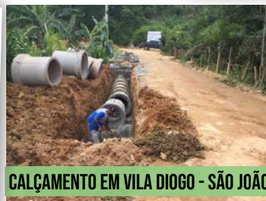
CALÇAMENTO EM VILA DIOGO - SÃO JOÃO