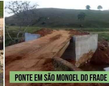
PONTE EM SÃO MONOEL DO FRADE