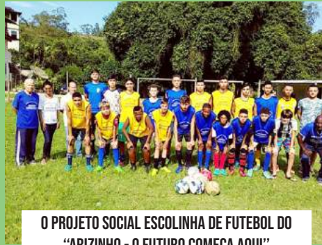
O PROJETO SOCIAL ESCOLINHA DE FUTEBOL DO "ARIZINHO - O FUTURO COMEÇA AQUI"

Tem como sede campo de futebol e o ginásio poliesportivo localizado na comunidade de Capivara, o projeto atende cerca de 120 jovens e adolescentes de 04 a 17 anos.