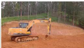
LIMPEZA DE TERRENOS