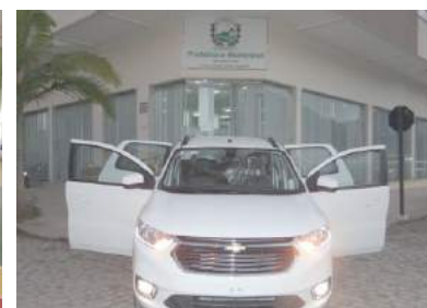
AQUISIÇÃO DE 05 VEÍCULOS