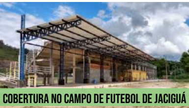
COBERTURA NO CAMPO DE FUTEBOL DE JACIGUÁ