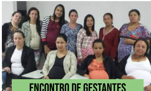
ENCONTRO DE GESTANTES