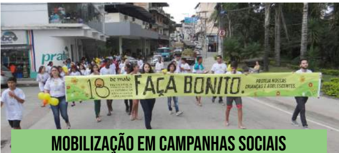
MOBILIZAÇÃO EM CAMPANHAS SOCIAIS