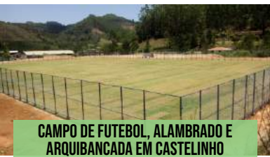
CAMPO DE FUTEBOL, ALAMBRADO E ARQUIBANCADA EM CASTELINHO