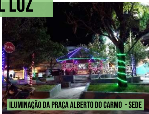
ILUMINAÇÃO DA PRAÇA ALBERTO DO CARMO - SEDE