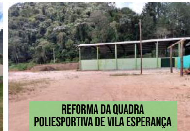
REFORMA DA QUADRA POLIESPORTIVA DE VILA ESPERANÇA