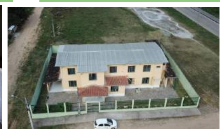
REFORMA E AMPLIAÇÃO DO ABRIGO