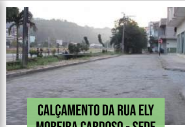
CALÇAMENTO DA RUA ELY MOREIRA CARDOSO - SEDE