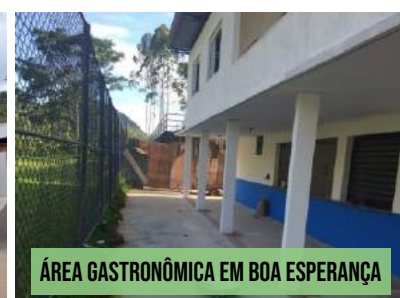
ÁREA GASTRONÔMICA EM BOA ESPERANÇA