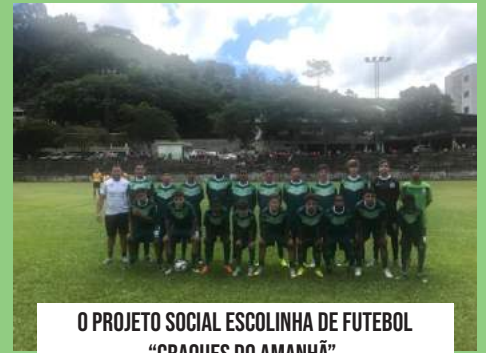
O PROJETO SOCIAL ESCOLINHA DE FUTEBOL "CRAQUES DO AMANHÃ",

O projeto Social tem como espaço de treinamento campo de Futebol Almiro Ofrante na sede do Município, o projeto atende cerca de 150 jovens e adolescentes de 04 a 17 anos.