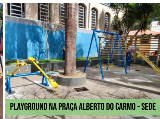
PLAYGROUND NA PRAÇA ALBERTO DO CARMO - SEDE