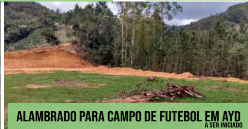
ALAMBRADO PARA CAMPO DE FUTEBOL EM AYD A SER INICIADO