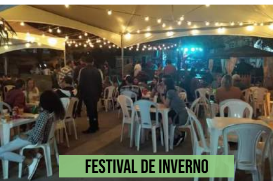
FESTIVAL DE INVERNO