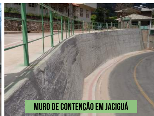
MURO DE CONTENÇÃO EM JACIGUÁ