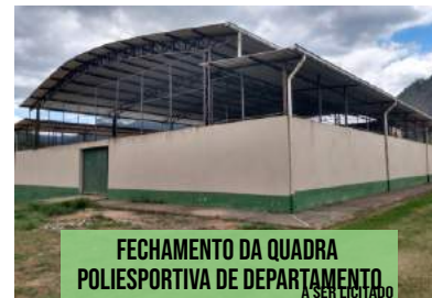
FECHAMENTO DA QUADRA POLIESPORTIVA DE DEPARTAMENTO A SER LICITADO