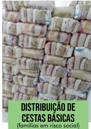
DISTRIBUIÇÃO DE CESTAS BÁSICAS (famílias em risco social)