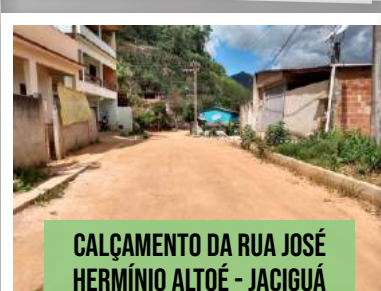
CALÇAMENTO DA RUA JOSÉ HERMÍNIO ALTOÉ - JACIGUÁ