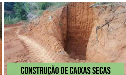
CONSTRUÇÃO DE CAIXAS SECAS