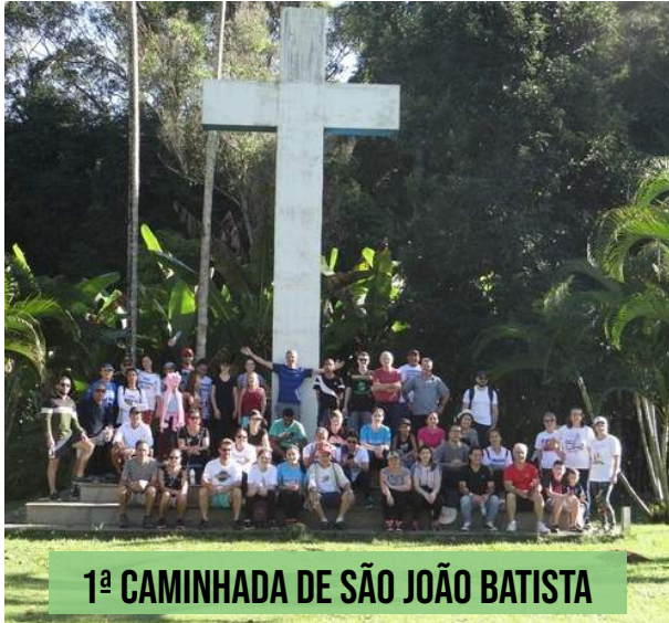
1ª CAMINHADA DE SÃO JOÃO BATISTA