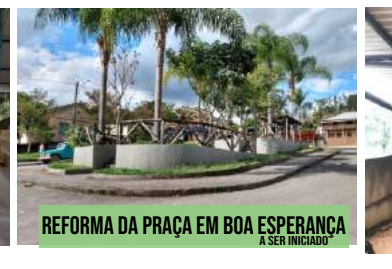
REFORMA DA PRAÇA EM BOA ESPERANÇA A SER INICIADO