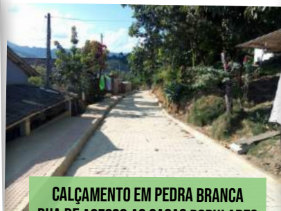
CALÇAMENTO EM PEDRA BRANCA RUA DE ACESSO AS CASAS POPULARES