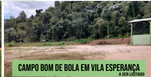
CAMPO BOM DE BOLA EM VILA ESPERANÇA A SER LICITADO