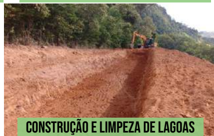
CONSTRUÇÃO E LIMPEZA DE LAGOAS