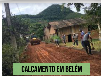
CALÇAMENTO EM BELÉM

PARCERIA COM A ASSOCIAÇÃO DE PAIS DA ESCOLA