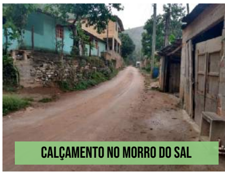
CALÇAMENTO NO MORRO DO SAL