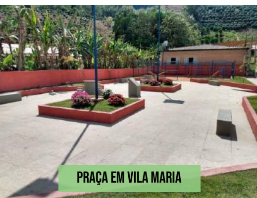
PRAÇA EM VILA MARIA