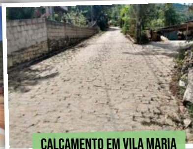
CALÇAMENTO EM VILA MARIA