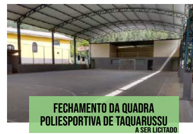
FECHAMENTO DA QUADRA POLIESPORTIVA DE TAQUARUSSU A SER LICITADO