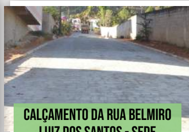
CALÇAMENTO DA RUA BELMIRO LUIZ DOS SANTOS - SEDE