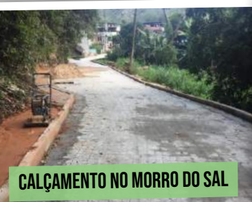
CALÇAMENTO NO MORRO DO SAL