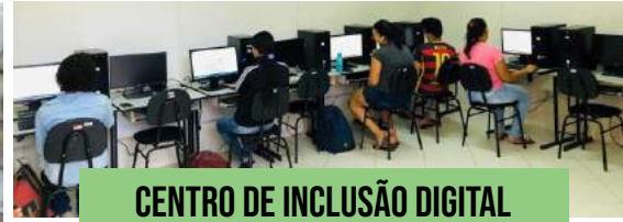
CENTRO DE INCLUSÃO DIGITAL