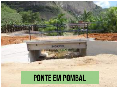
PONTE EM POMBAL