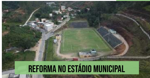
REFORMA NO ESTÁDIO MUNICIPAL