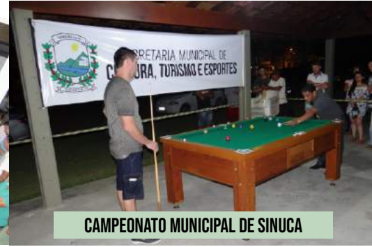
CAMPEONATO MUNICIPAL DE SINUCA