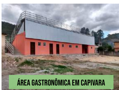
ÁREA GASTRONÔMICA EM CAPIVARA