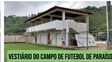
VESTIÁRIO DO CAMPO DE FUTEBOL DE PARAÍSO