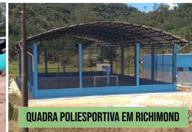
QUADRA POLIESPORTIVA EM RICHMOND