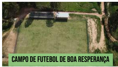
CAMPO DE FUTEBOL DE BOA ESPERANÇA