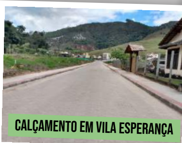
CALÇAMENTO EM VILA ESPERANÇA