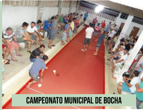
CAMPEONATO MUNICIPAL DE BOCHA