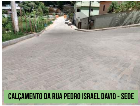
CALÇAMENTO DA RUA PEDRO ISRAEL DAVID - SEDE

GOVERNO DO ESTADO LIBERA R$ 900 MIL PARA RECUPERAR A AVENIDA TUFFI DAVID Com o repasse o município poderá recuperar toda a infraestrutura danificada com obras de pavimentação asfáltica, drenagem em alguns pontos que ainda não existe e a construção das vias laterais, as "sarjetas".