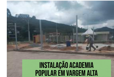
INSTALAÇÃO ACADEMIA POPULAR EM VARGEM ALTA