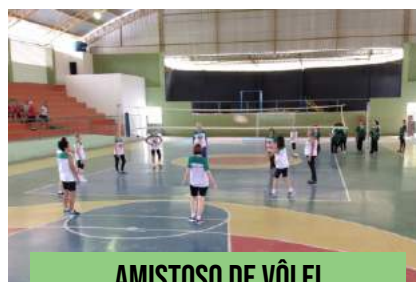
AMISTOSO DE VÔLEI ADAPTADO PARA IDOSOS