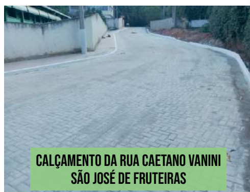
CALÇAMENTO DA RUA CAETANO VANINI SÃO JOSÉ DE FRUTEIRAS