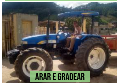
ARAR E GRADEAR