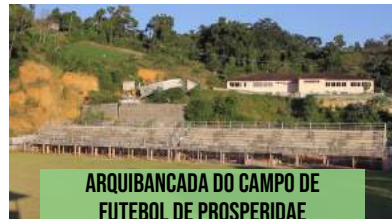
ARQUIBANCADA DO CAMPO DE FUTEBOL DE PROSPERIDADE