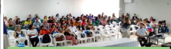
REALIZAÇÃO DE CONFERÊNCIAS MUNICIPAIS