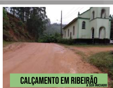
CALÇAMENTO EM RIBEIRÃO JÁ SER INICIADO