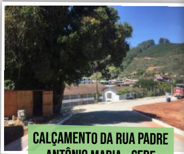
CALÇAMENTO DA RUA PADRE ANTÔNIO MARIA - SEDE