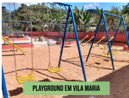
PLAYGROUND EM VILA MARIA