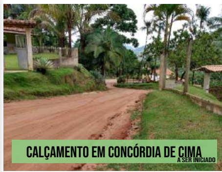
CALÇAMENTO EM CONCÓRDIA DE CIMA A SER INICIADO