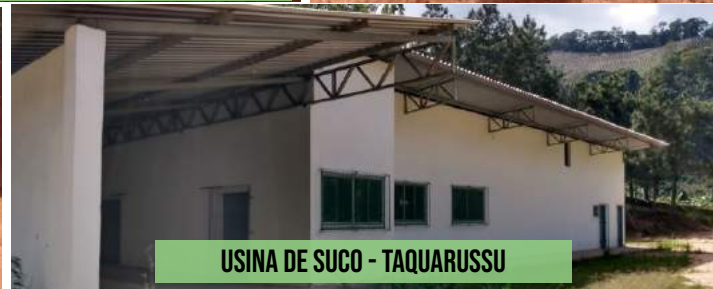
USINA DE SUCO - TAQUARUSSU