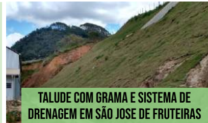
TALUDE COM GRAMA E SISTEMA DE DRENAGEM EM SÃO JOSE DE FRUTEIRAS