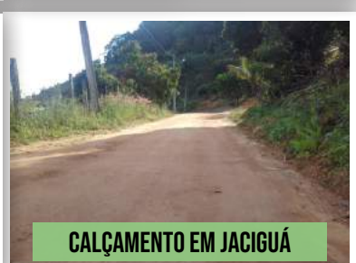
CALÇAMENTO EM JACIGUÁ