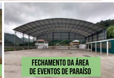
FECHAMENTO DA ÁREA DE EVENTOS DE PARAÍSO