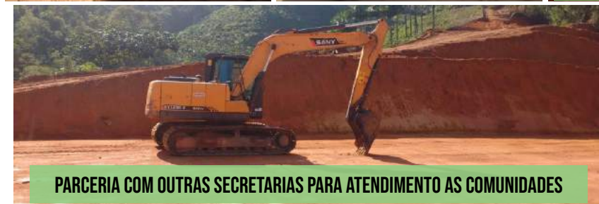
PARCERIA COM OUTRAS SECRETARIAS PARA ATENDIMENTO AS COMUNIDADES