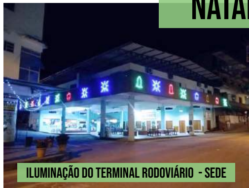
ILUMINAÇÃO DO TERMINAL RODOVIÁRIO - SEDE