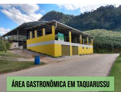
ÁREA GASTRONÔMICA EM TAQUARUSSU