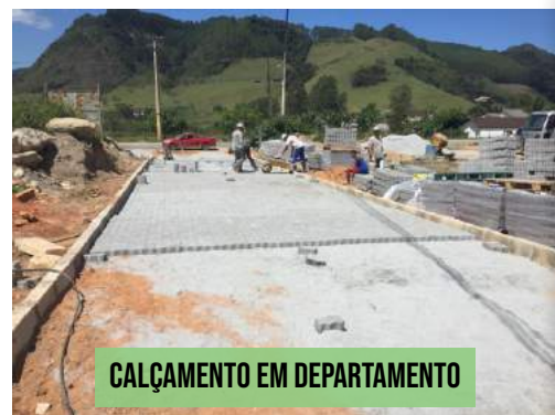
CALÇAMENTO EM DEPARTAMENTO