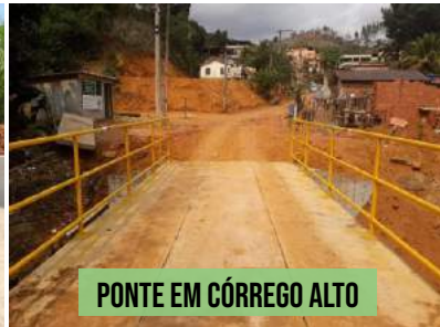
PONTE EM CÓRREGO ALTO