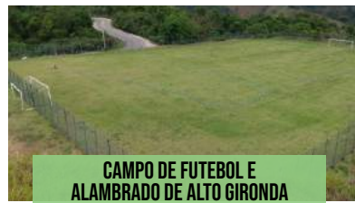
CAMPO DE FUTEBOL E ALAMBRADO DE ALTO GIRONDA