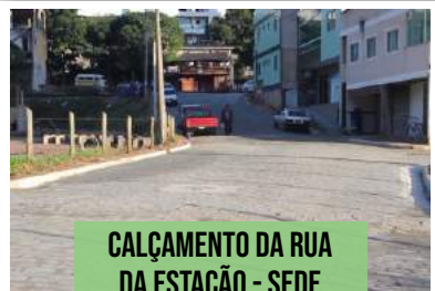
CALÇAMENTO DA RUA DA ESTAÇÃO - SEDE