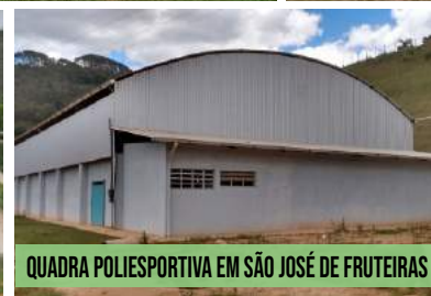
QUADRA POLIESPORTIVA EM SÃO JOSÉ DE FRUTEIRAS