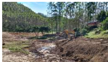
CONSTRUÇÃO DE BARRAGENS