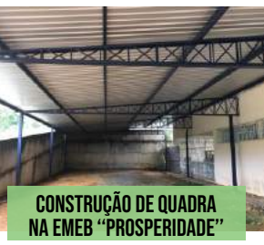
CONSTRUÇÃO DE QUADRA NA EMEB "PROSPERIDADE"