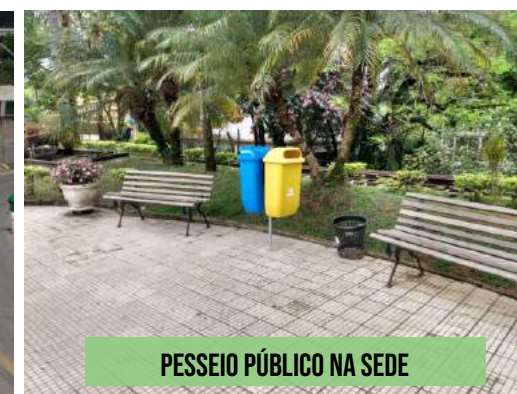
PESSOIO PÚBLICO NA SEDE