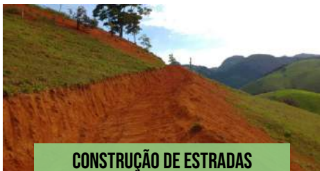
CONSTRUÇÃO DE ESTRADAS