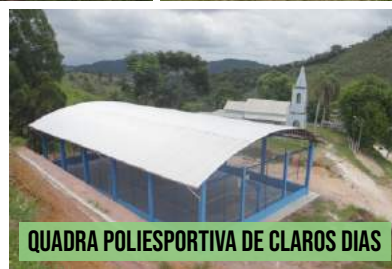
QUADRA POLIESPORTIVA DE CLAROS DIAS