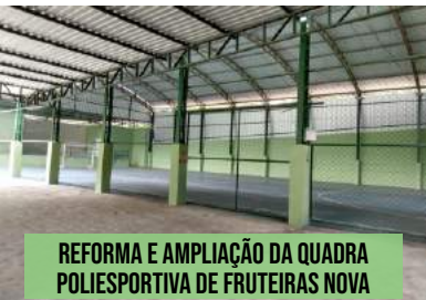
REFORMA E AMPLIAÇÃO DA QUADRA POLIESPORTIVA DE FRUTEIRAS NOVA