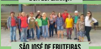
SÃO JOSÉ DE FRUTEIRAS