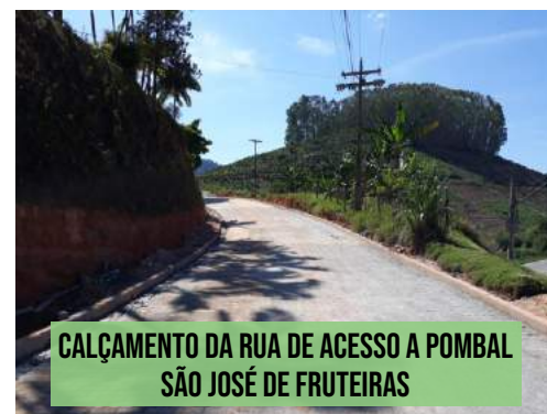
CALÇAMENTO DA RUA DE ACESSO A POMBAL SÃO JOSÉ DE FRUTEIRAS