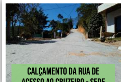
CALÇAMENTO DA RUA DE ACESSO AO CRUZEIRO - SEDE