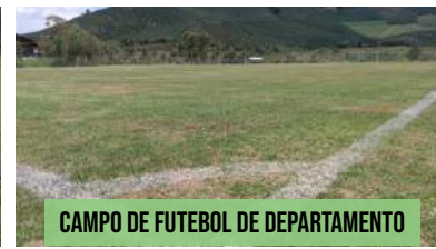
CAMPO DE FUTEBOL DE DEPARTAMENTO