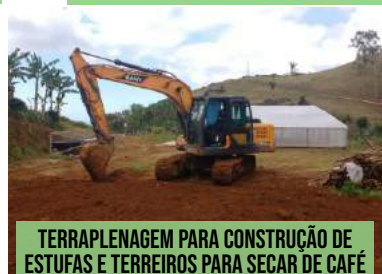
TERRAPLENAGEM PARA CONSTRUÇÃO DE ESTUFAS E TERREIROS PARA SECAR DE CAFÉ