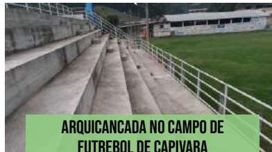
ARQUICANCADA NO CAMPO DE FUTEBOL DE CAPIVARA