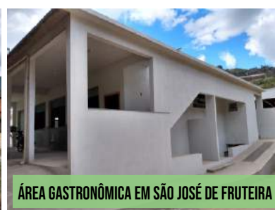
ÁREA GASTRONÔMICA EM SÃO JOSÉ DE FRUTEIRA