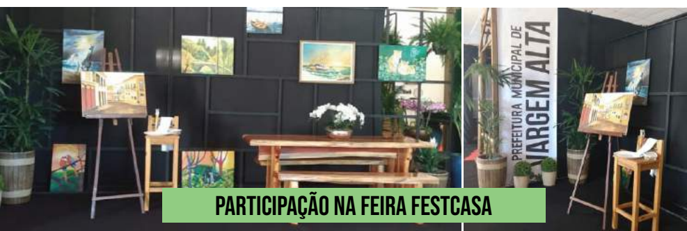
PARTICIPAÇÃO NA FEIRA FESTCASA

Secretaria de Turismo de Vargem Alta, presente! Várias reuniões com os secretários dos Municípios que compõe as Montanhas Capixabas na pauta investimentos no turismo, dificuldades enfrentadas, meios de fazer o turismo se desenvolver.