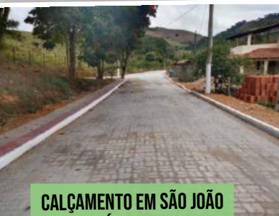
CALÇAMENTO EM SÃO JOÃO RUA PRÓXIMO A IGREJA