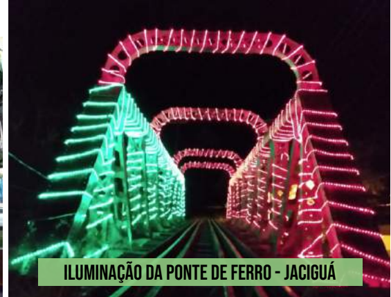
ILUMINAÇÃO DA PONTE DE FERRO - JACIGUÁ