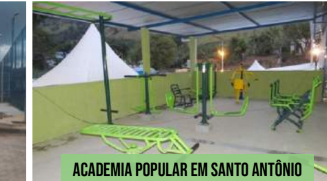
ACADEMIA POPULAR EM SANTO ANTÔNIO

ACADEMIA POPULAR EM SANTANA, BOA ESPERANÇA, RICHMOND - A SER INSTALADA