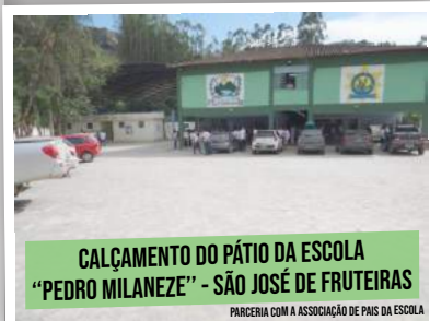
CALÇAMENTO DO PÁTIO DA ESCOLA "PEDRO MILANEZE" - SÃO JOSÉ DE FRUTEIRAS

PARCERIA COM A ASSOCIAÇÃO DE PAIS DA ESCOLA