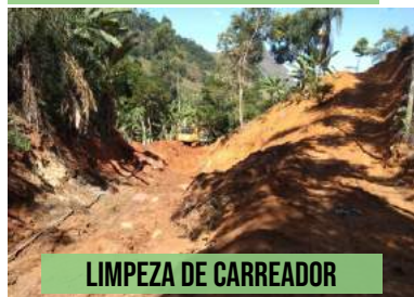
LIMPEZA DE CARREADOR