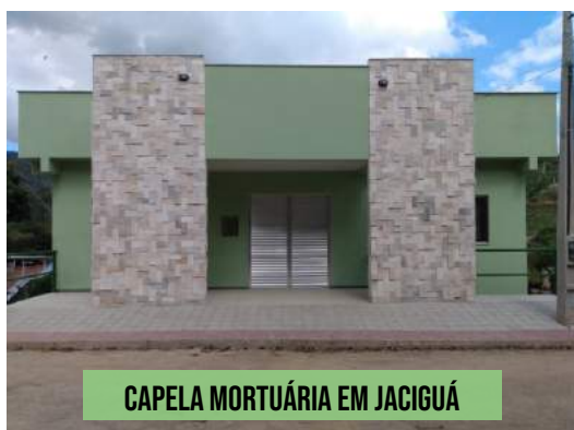
CAPELA MORTUÁRIA EM JACIGUÁ