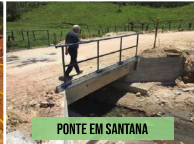
PONTE EM SANTANA