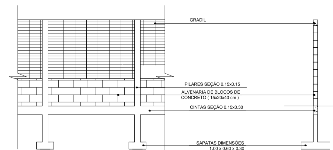
DETALHAMENTO DO GRADIL E MURETA ESC.: INDICADA