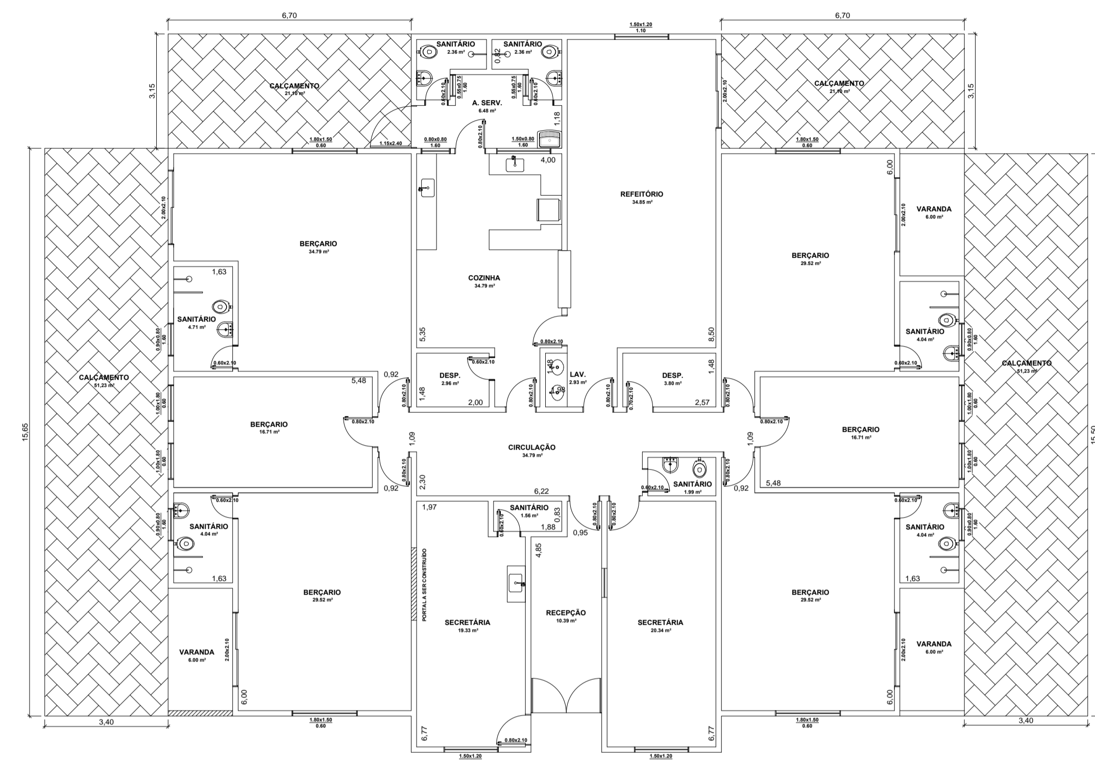
PLANTA BAIXA CALÇAMENTO ESC.: 1/100