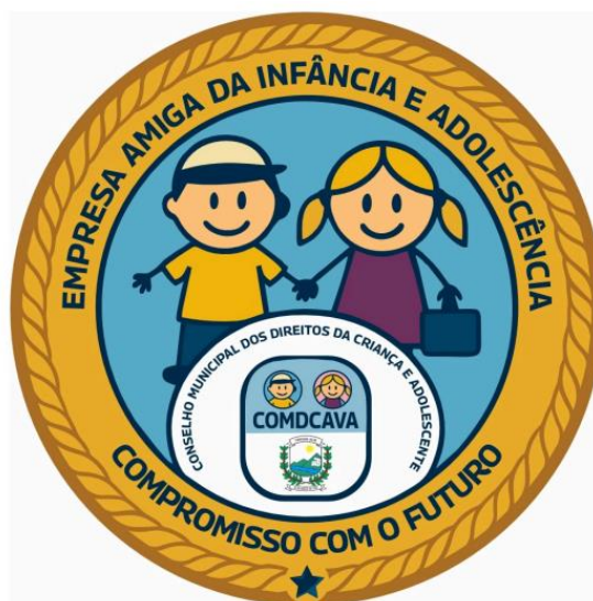
Legenda: Arte oficial do Selo “Empresa Amiga da Infância e Adolescência” – Município de Vargem Alta/ES.